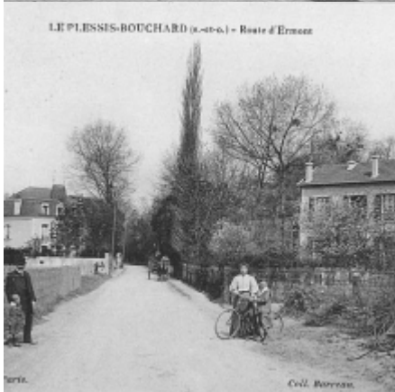
LE PLESSIS-BOUCHARD (S.-et-O.) — Route d'Ermenonville