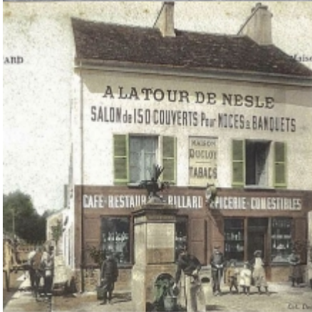
A LA TOUR DE NESLE SALON de 150 COUVERTS Pour NOCES et BANQUETS TABACS CAFE-RESTAURANT BILLARD PÂTISSERIE CONCOMESTIBLES