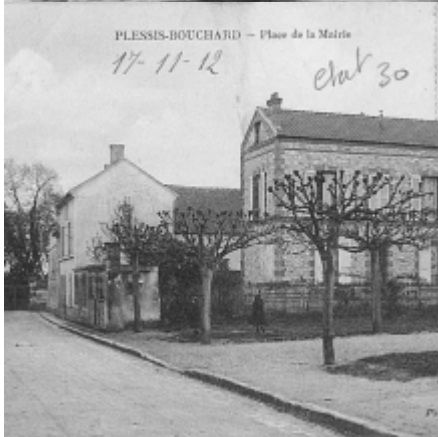
PLESSIS-BOUCHARD — Place de la Mairie