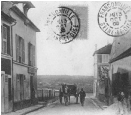
LE PLESSIS-BOUCHARD — Entree du Plessis — Collé Saint Léa