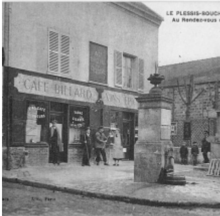
LE PLESSIS-BOUCHARD Au Rendez-vous