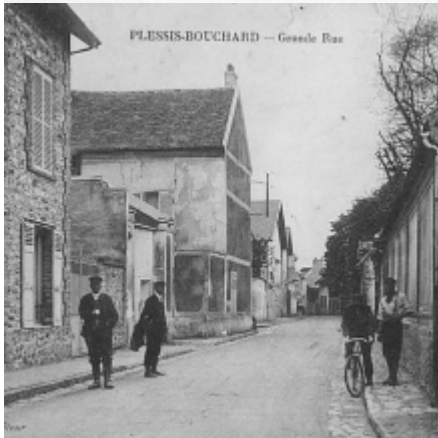
PLESSIS-BOUCHARD — Grande Rue