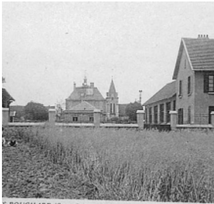
S-BOUCHARD (S.-et-O.). — Vue prise de Francoville : Mairie.