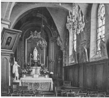
LE PLESSIS BOUCHARD (S.-&-O.) — Intérieur de l'Eglise