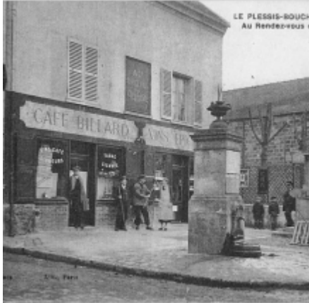
LE PLESSIS-BOUCHARD Au Rendez-vous