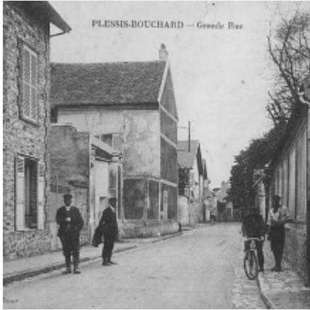
PLESSIS-BOUCHARD — Grande Rue