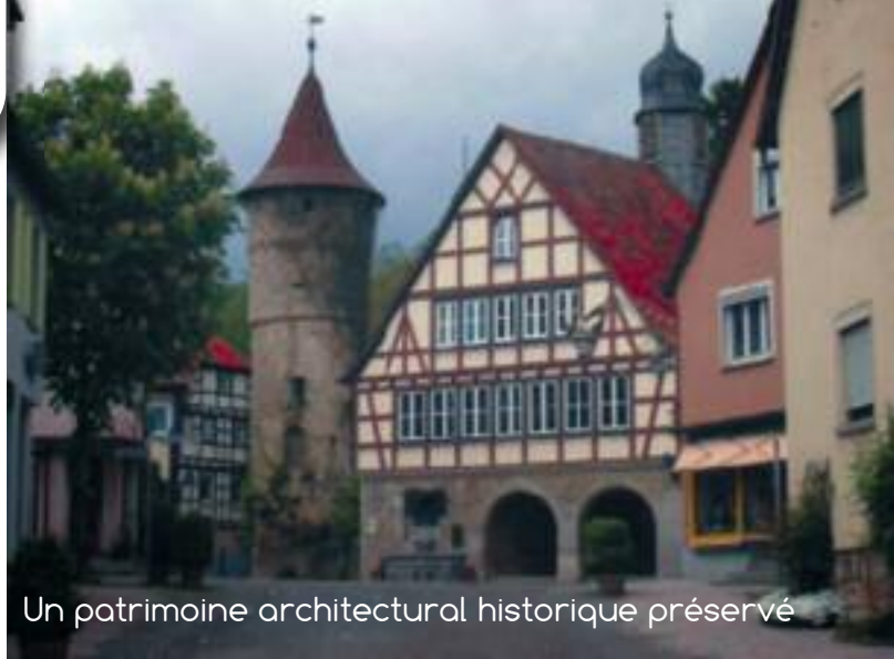
Un patrimoine architectural historique préservé

Une fiche d'inscription à ce séjour sera disponible sur le site internet de la ville (rubrique services en ligne) à partir du 20 mai ou auprès du service culturel : centre culturel « Jacques Templier » - 01 34 13 35 44