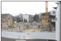
Au fil des travaux