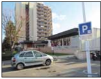
Le point sur les zones bleues