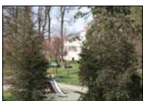
Aux petits soins pour le parc