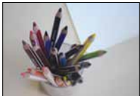
Inscriptions et agenda des écoles