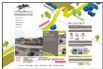
Un nouveau site internet moderne et clair