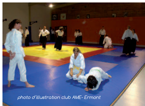
photo d'illustration club AME- Ermont

site : https://sites.google.com/site/catpbara/