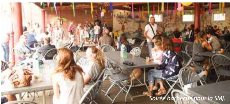
Soirée barbecue pour la SMJ.