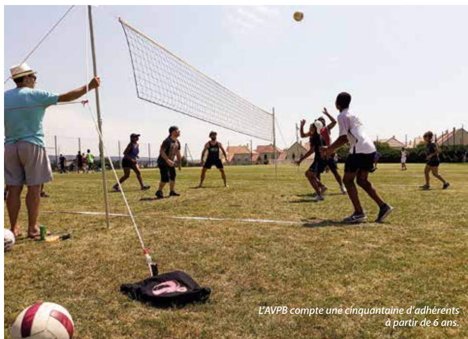
L'AVPB compte une cinquantaine d'adhérents à partir de 6 ans.

06 81 95 23 67 ou 06 09 76 73 53 avpb@avpb.fr Page Facebook : Association des Volleyeurs du Plessis-Bouchard