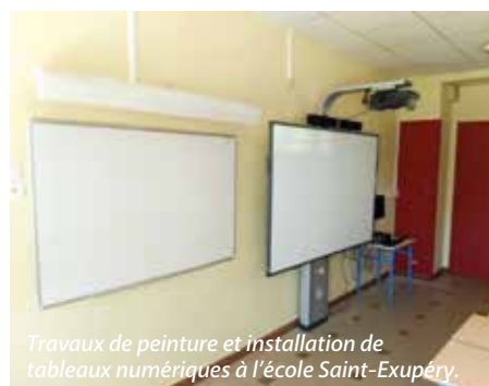
Travaux de peinture et installation de tableaux numériques à l'école Saint-Exupéry.

Comme chaque année, la ville a profité de la relative tranquillité estivale pour procéder à différents travaux, aussi bien en régie que via des prestataires extérieurs. Parmi les « devoirs de vacances » 2018, des interventions dans les écoles, à la cuisine centrale, au gymnase Alexopoulos, à la Maison de l'Enfance et à l'EMAM.