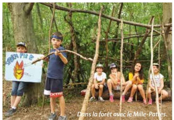
Dans la forêt avec le Mille-Pattes.