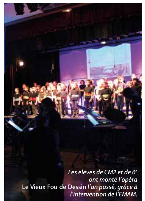
Les élèves de CM2 et de 6 e ont monté l'opéra Le Vieux Fou de Dessin l'an passé, grâce à l'intervention de l'EMAM.

Des projets en commun voient le jour entre les élèves de CM2 et 6 e , aussi bien en sports qu'en arts (écriture de contes, arts plastiques, séances d'agrès, opéra, etc.). L'occasion pour les futurs collégiens de se familiariser avec leur futur établissement.