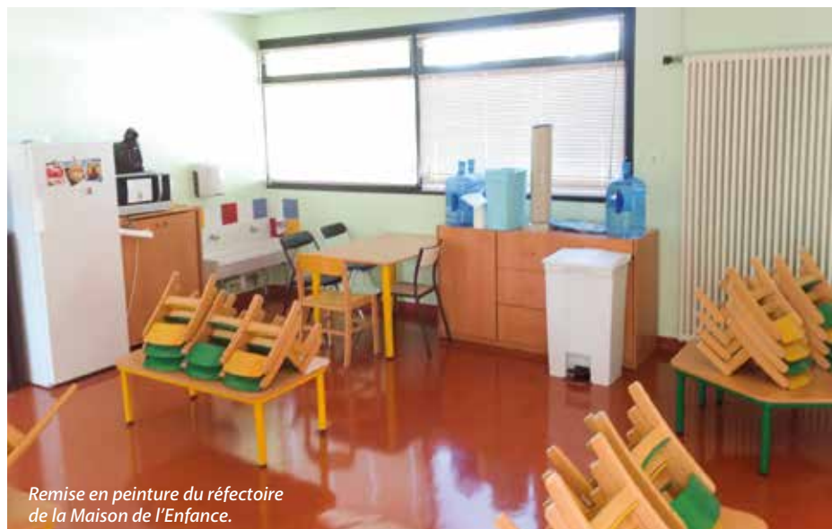
Remise en peinture du réfectoire de la Maison de l'Enfance.