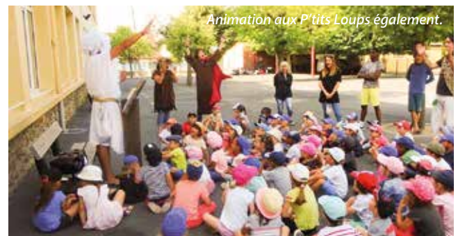
Animation aux P'tits Loups également.