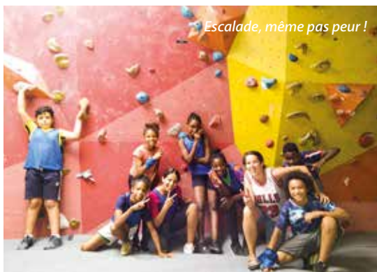
Escalade, même pas peur !