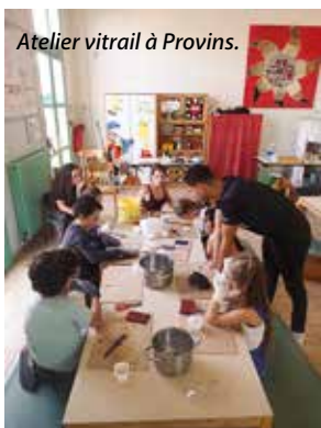
Atelier vitrail à Provins.

C'est ainsi que l'on peut résumer les deux mois de vacances dans nos accueils de loisirs et à la SMJ. Le défi des équipes d'animation ? Concocter des programmes d'activités répondant aux attentes et souhaits de chacun. Au vu des sourires sur les photos, on peut dire sans trop se tromper que ces professionnels ont relevé le défi haut la main ! Petits et plus grands ont croqué l'été à pleines dents... sous le soleil exactement ! Tour d'horizon en images.