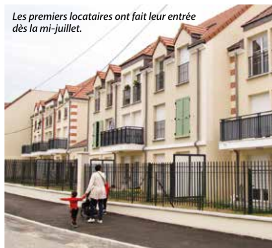
Les premiers locataires ont fait leur entrée dès la mi-juillet.