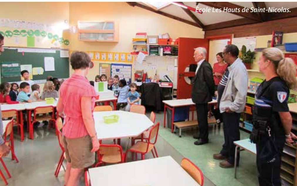
École Les Hauts de Saint-Nicolas.

RETROUVEZ TOUTES LES PHOTOS SUR LE SITE DE LA VILLE