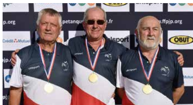
Équipe championne de France 2022/2023